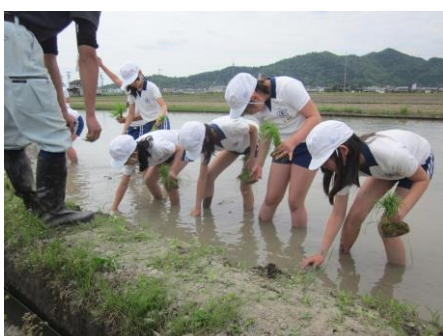
↑田んぼの学校 能登川東小学校5年生を対象とした、 田んぼの学校を開催いたしました。田 植え体験の様子です。