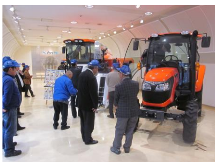
↑農事改良組合・ 営農組合 合同研修 12月21日、堺市のクボタ堺製造所 で現地研修を行いました。