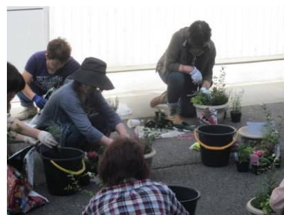
↑女性セミナー 女性の方を対象としたセミナーを開催 いたしました。写真はガーデニング教 室の様子です。