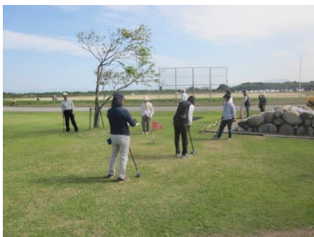
↑年金友の会 グランドゴルフ大会 9月29日、ふれあい運動公園にて開催 いたしました。