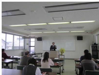
↑年金セミナー 4月12日、「知らなきゃ損する!?退職 前後の賢い手続き方法や年金のしく みについて」のセミナーを開催しま した。