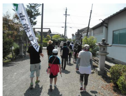
↑ウォーキング大会 5月30日、ウォーキング大会を開催 し、20名の方に参加いただきました。 垣見町-躰光寺町-小川町を散策し ました。。